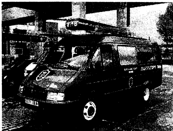
Рис. 1. Загальний вигляд мобільної лабораторії для експрес-контролю кількості та якості нафтопродуктів

0,4% в діапазоні номінальних витрат 0,04-0,16 м 3 /год (комплект мірників з похибкою ±0,1%; секундомір з похибкою ±0,2 с; набір термометрів з діапазоном вимірювань -60 ... +50 °С);