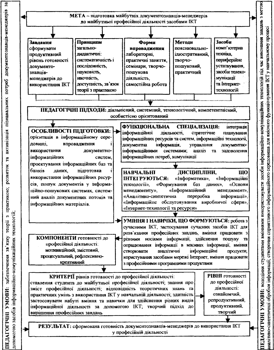
Рис. 1. Модель формування готовності документознавців-менеджерів до майбутньої професійної діяльності засобами ІКТ