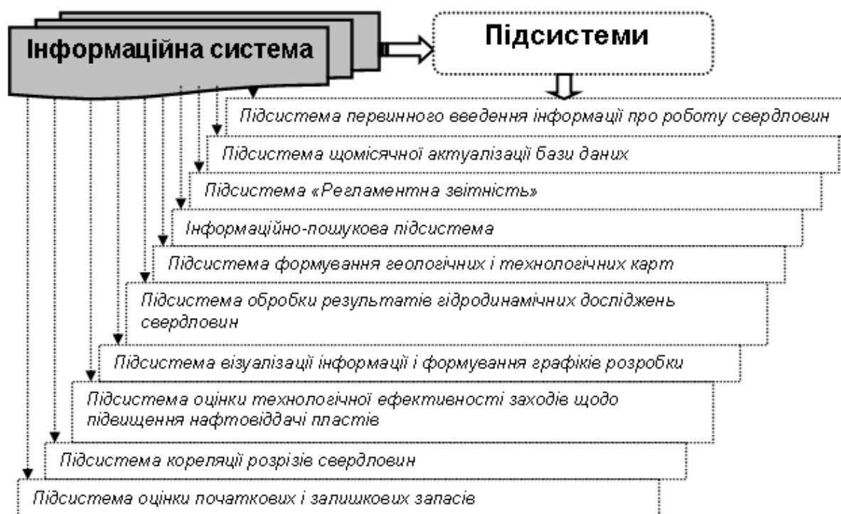
Рисунок 2 – Прикладні підсистеми інформаційної системи нафтогазовидобувного виробництва

нафтовидобування є невід’ємною частиною моделі даних корпоративної системи нафтової компанії. Необхідність єдиного інформаційного забезпечення обумовлена вимогою одноманітності інформаційних обмінів і документообігу між всіма підрозділами і рівнями управління нафтової компанії, накопичення інформації в базах даних, забезпечення безпеки даних, проведення єдиної технічної політики з розвитку інформаційних технологій [9, с.4].