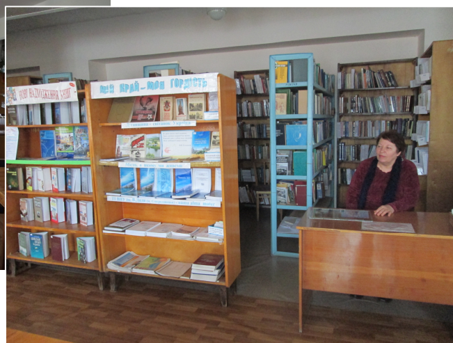
Абонемент НБ СЛУ ім. В.Даля

Навіть в тих умовах, що склалися, бібліотека поповнюється новими надходженнями літератури. Завдяки науковцям та викладачам різних закладів науки та освіти України, до бібліотеки надійшло більше 1000 примірників підручників, монографій та іншої навчальної і наукової літератури у паперовому та електронному варіантах. Крім того, тривають надходження дисертацій, авторефератів дисертацій, монографій, матеріалів наукових конференцій.