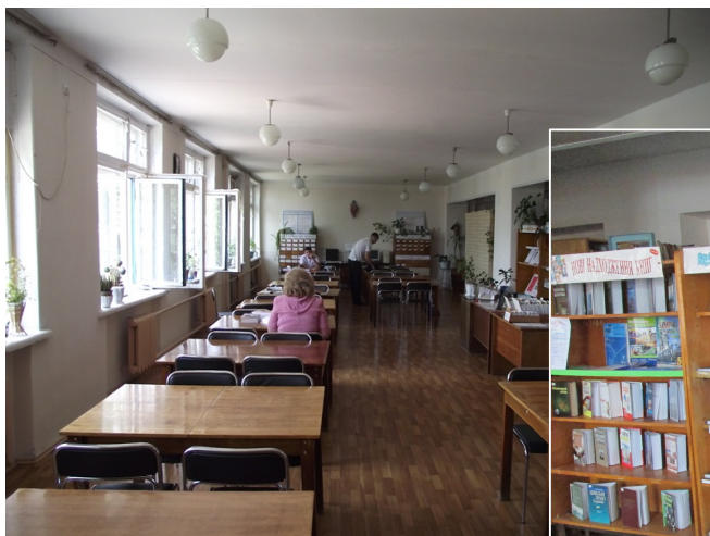
Читальний зал НБ СЛУ ім. В.Даля (м. Северодонецьк)

Наукова бібліотека університету була і залишається головною лабораторією вишу. Зараз йде робота з відновлення роботи бібліотеки в евакуйованому університеті. Незважаючи на всі труднощі, що існують сьогодні, ми намагаємось створити комфортні умови для самостійної роботи студентів з книжковим фондом, надаємо доступ до електронних ресурсів, створених власноруч, та ресурсів Інтернету.