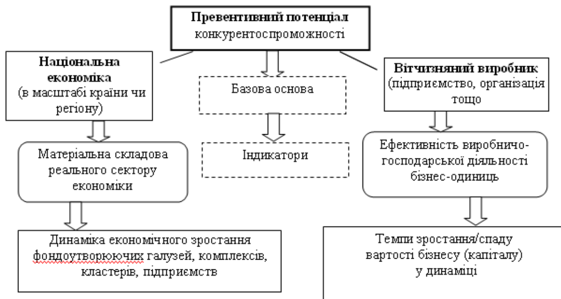
Рис. 1 – Основні базові фактори формування превентивного потенціалу конкурентоспроможності

На наше переконання використання принципів превентивності у механізмі забезпечення конкурентоспроможності для суб'єктів ринкових відносин будь-якого рівня дозволить сформувати умови щодо набуття стратегічного рівні конкурентоспроможності із відповідною збалансованістю на оперативному та тактичному рівнях. З огляду на вищезазначене та з метою запобігання негативного впливу гіперконкуренції для вітчизняних гравців ринку, пропонуємо запровадження в практичне використання як інструменту дії розглянутих принципів - превентивного потенціалу конкурентоспроможності (див. рис.1).