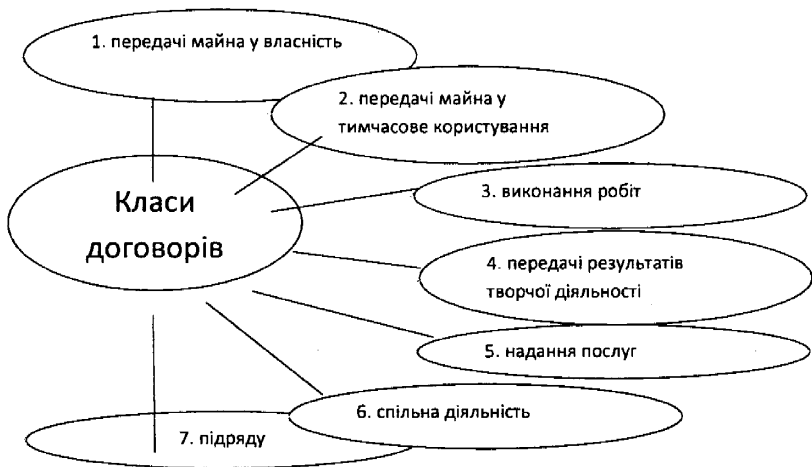
Рис.1. Класифікація договорів за критерієм правової мети (Луць В.В.)

Взявши за основу у якості критерію класифікації договорів правову мету професор В.В. Луць [7] запропонував наступне їх ґрунтування (Рис.1).